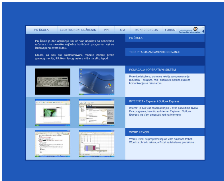
Slika 1. Modul vezan za Informacione sisteme