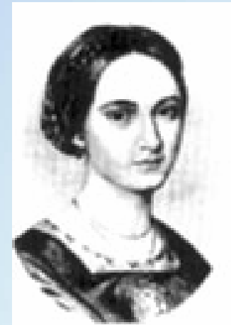
Милица Стојадиновић Српкиња