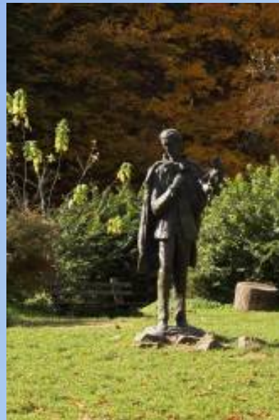
Споменик Бранка Радичевића