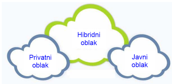
Slika 3: Modeli oblaka

Postoje tri glavna modela upotrebe računarstva u oblaku, a to su: javni, privatni i hibridni oblak, od kojih svaki ima svoje prednosti i nedostatke [4]. Korisnici oblaka nisu ograničeni na upotrebu samo jednog modela, mogu da ih kombinuju kako bi na što bolji način iskoristili potencijal različitih modela oblaka i kroz to ispunili svoje ciljeve (slika 3).