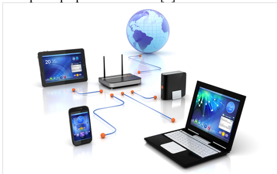
Slika 1: Opšti prikaz koncepta Cloud Computing-a

Računarstvo u oblaku se odnosi na interakciju između korisnika i različitih servisa koji su pristupačni na Internetu (slika 1). Sama tehnologija ostaje nevidljiva za krajnjeg korisnika usluga [2]. Kako se Internet razvija, računarstvo u oblaku dobija sve više resursa, zamenjuje se kućni računar i omogućava se svakom korisniku da svojim podacima, aplikacijama i servisima pristupa preko Interneta [3].