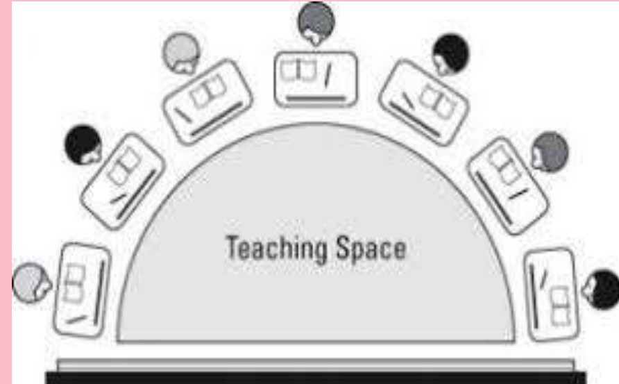
KLUPE U POLUKRUG