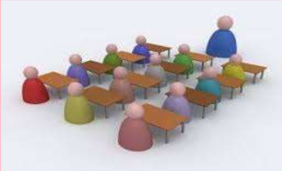
KLUPE U REDOVIMA