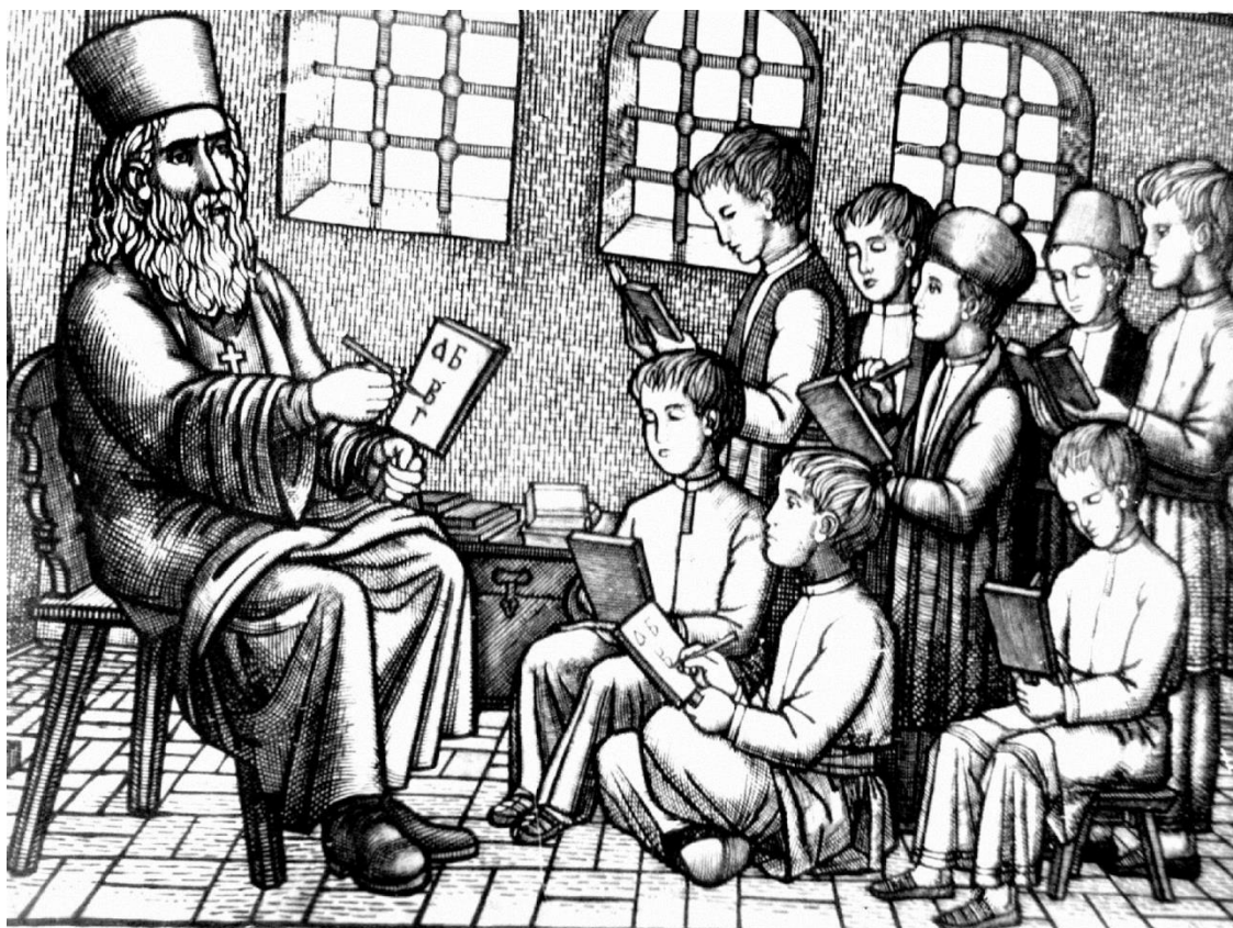
Српска школа у Старој Србији

Ове школе отварали су свеснији и имућнији појединци и издржавали их сами или уз помоћ суграђана. У свим већим местима, од најугледнијих људи били су образовани црквено–школски одбори, чији је задатак био да се старају о школама и црквама. Образовање ових одбора говори о досеглој свести српског становништва на простору Старе Србије, које је, и поред опште заосталости, присутне у Османском царству, у цркви и школи препознало институције битне за њихов национални опстанак и даљи развој. Значај ових институција препознала је и држава Србија која је често слала новац за њихово одржавање. Новац су неретко добијали и манастири, који су добијена средства користили за обнављање и изградњу цркава, конака и других просторија. До седамдесетих година XIX века новац су добијали манастири: Дечани, Пећка Патријаршија, Свети Марко код Призрена, Грачаница, Свето Преображење код Пећи, Драганац код Гњилана и цркве у Призрену, Ђаковици, Муштутишту, Неродимљу, Липљану. У конацима неких од њих ће се касније отворати манастирске школе. Сачувани подаци говоре о школама у Грачаници, Дечанима, Девичу, Дубоком Потоку, Врачеву, Драганцу, а било их је и у другим манастирима.