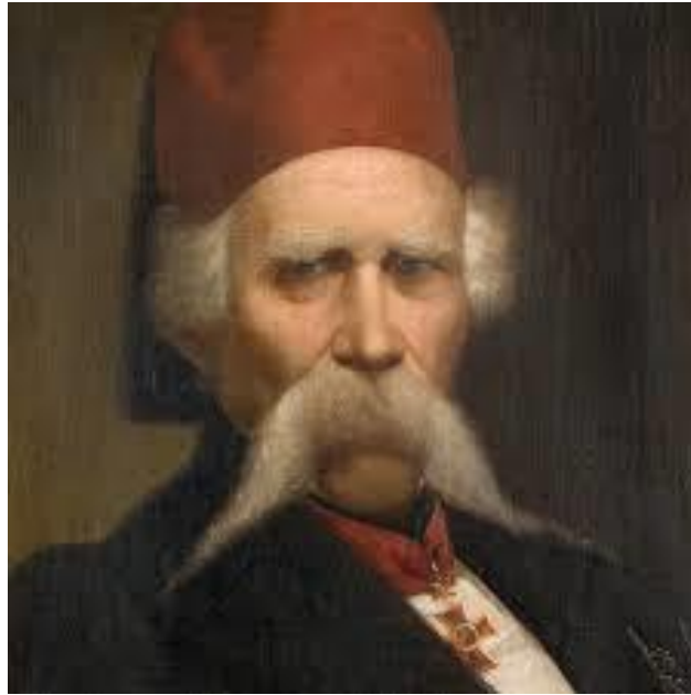
Вук Стефановић Караџић

Ипак, делови српских територија који су били под Турцима у највећој мери нису обухваћени деловањем двојице просветитеља. И као што су се просветитељске идеје шириле Србијом тако се и слобода српске државе лагано ширила, све док 1878. године Србија и Црна Гора нису стекле потпуну независност. Ова година је једном делу српског становништва донела слободу, али је на територији Косова и Метохије донела негативне промене. Све до Берлинског конгреса Срби су на Косову и Метохији представљали већину, али од тада, пристизањем мухаџира из Босне и четири округа (Нишки, Топлички, Врањски и Пиротски) припојених Србији, као и непрестаним сељењем у ослобођену државу због зулума које су непрестано трпели, етничка слика се значајно променила на штету Срба, који су постали мањина. Како је време одмицало промене на Косову и Метохији настале на Берлинском конгресу попримале су све горе размере, а положај српског становништва постајао је све тежи. Ослобођење 1912. године, пристигло је у последњем тренутку, јер су се зулуми, удружени са деловањем власти, толико умножили да су претили да потпуно иселе српско становништво са Косова и Метохије.