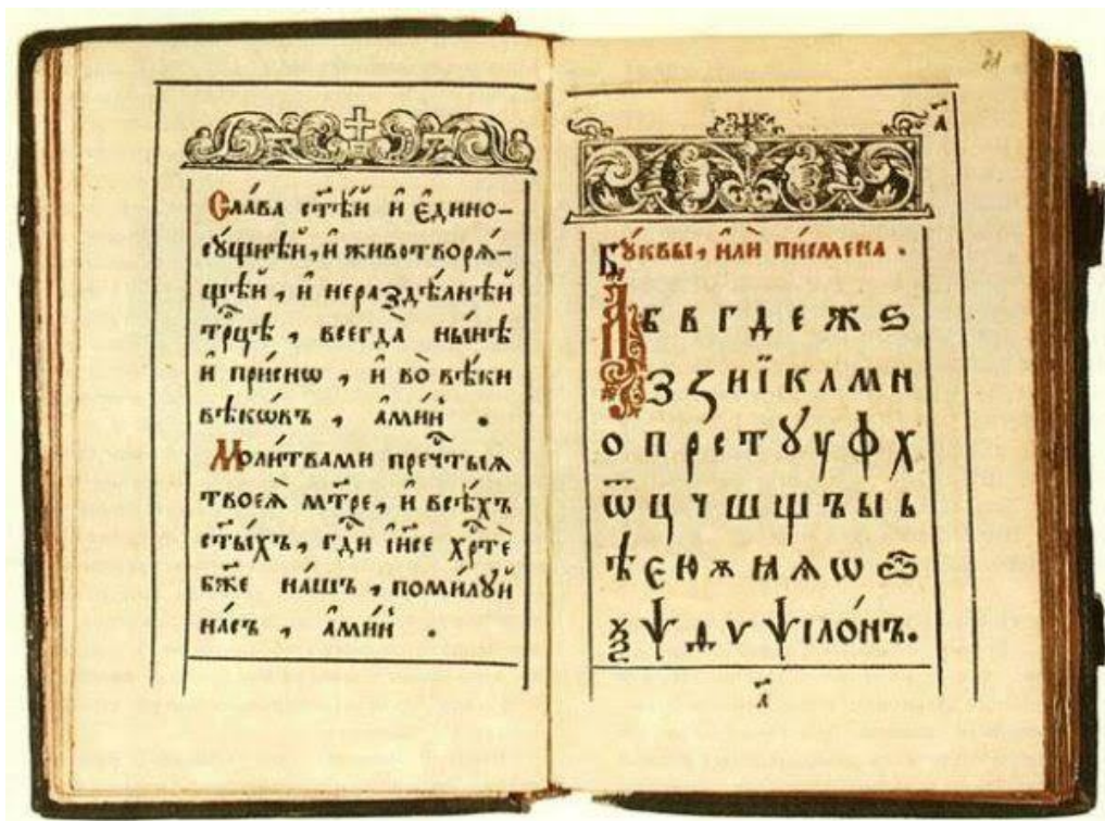
Први српски буквар

Ови појединачни домети српске културе и писмености били су преостали одсјај великих достигнућа средњег века. Турска владавина гушила је сва настојања духовног стваралаштва јер је у томе видела опасност по свој опстанак на окупираним територијама. С друге стране, српски народ се није мирио са турском окупацијом коју је сматрао привременом, због чега је предузимао бројне побуне. Српски народ је сваки покрет хришћанских трупа против Османлија искрено прихватао и у њима учествовао. Два продора аустријске војске до Старе Србије крајем XVII и у првој половини XVIII века довела су до великих сеоба Срба са Косова и Метохије према северу. Избеглички народ у два сеобама предводила су два пећка патријарха Арсеније III Чарнојевић и Арсеније IV Јовановић Шакабента. Егзодус српског народа и опустео трон српске патријаршије уназадили су стање писмености преосталог народа. Турци су били свесни да су пећки патријарси духовни и политички предводници Срба, па су зато 1766. године укинули Пећку патријаршију, а наредне 1767. и Охридску архиепископију. Био је то тежак ударац опстанку српског народа и његовој култури. У области проређеног српског становништва досељавају се Арбанаси из крајева западно од Проклетија, а на места архијереја долазили су Грци, који често нису знали српски језик, а проблеме српског народа нису доживљавали као своје.