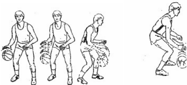
вођење лопте у место сл.1,2

Деца су савладала вођење лопте ако: воде лопту и левом и десном руком, воде лопту а да не нарушавају брзину и смер кретања, воде лопту а да је при томе не гледају. Вежбе које користимо за савладавање ове индивидуалне активности у настави физичког васпитања позитивно утичу на моторичке способности деце а, нарочито на координацију. Уз употребу и осталих реквизита веома лако се примењују у школи (фискултурна сала или отворени терен) а, деца ове садржаје лако и брзо усвајају.