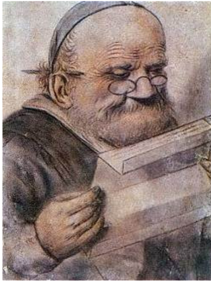
Сл. 3 Франсоа Рабле

Сликарство остварује највеће уметничке домете. Најважнији је портрет, теме из свакодневног живота, библијска и историјска тематика. Јавља се перспектива.