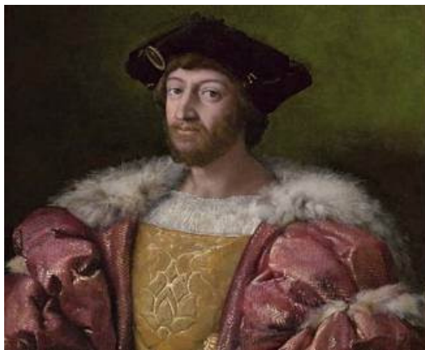
Сл. 1 Лоренцо Медичи

Лик новог човека има у себи својства најузвишенијег и најплеменитијег достигнућа природе, он је као неки смртни бог.