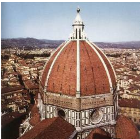
Сл. 4 Брунелески, купола Санта Марија дел Фјоре

Славна су имена: Ђорџоне, Да Винчи, Рафаел, Ботичели, Тинторето, Тицијан, Дирер, Јан ван Ајк. Најславнији вајар је Микеланђело. Најпознатији уметници архитектуре су Брунелески, Браманте и Микеланђело.