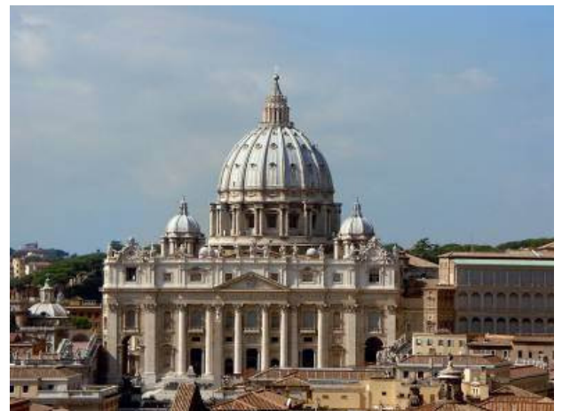
Сл. 5 Микеланђело, базилика Св. Петка